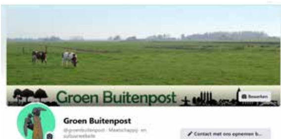
Ter ondersteuning van haar 'groene' projecten heeft PBB kort geleden de Facebookpagina Groen Buitenpost in het leven geroepen.