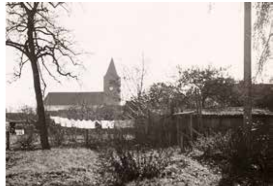
Moestuinen achter de Kerkstraat, rond 1930.

Nog geen eeuw geleden was het heel gebruikelijk dat mensen een deel van hun eigen voeding verbouwden in een moestuin of kleine boomgaard. De oogst werd vaak direct gebruikt of ingemaakt. Wij willen met dit project proberen onze inwoners te stimuleren in die zin terug te grijpen op het verleden. De cultuurhistorie speelt ook een rol bij de oude fruitrassen die we graag terug willen brengen in het dorp.