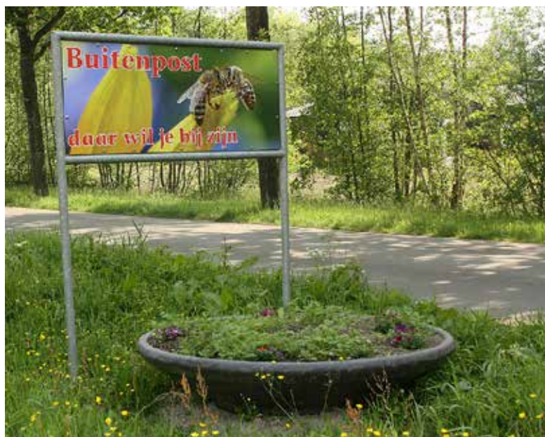
Misschien is dit wel de beste samenvatting van wat wij met ons project willen. Het motto van de bijdrage van PBB aan Kulturele Haadstêd LF2018: "Buitenpost, daar wil je bij zijn".

Wij hopen dat dit projectplan op veel steun van haar dorpsgenoten, organisaties en sponsors en subsidiegevers mag rekenen!