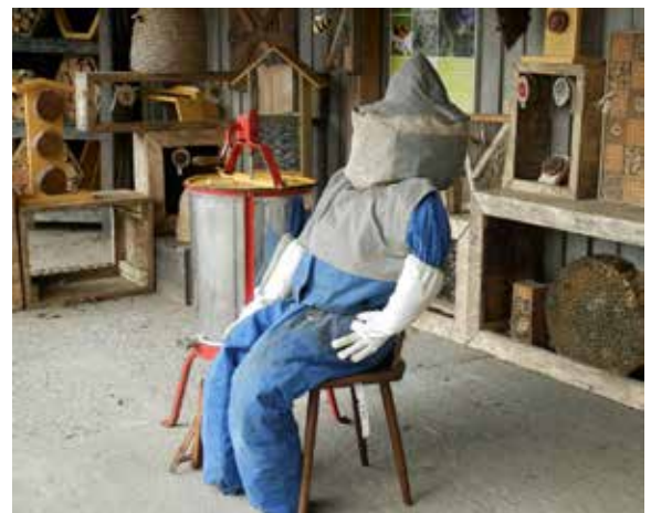
Het grotere bewustzijn van en contact met de natuur kan leiden naar een bezigheid als de bijenhouderij. Deze pop diende als demonstratie op de Kruidhof.

Het is heel goed voorstelbaar dat meer contact met en kennis van de natuur inwoners ertoe aan gaat zetten om verwante activiteiten te gaan ontplooiën. Wij denken bijvoorbeeld aan bijenhouderij, het gebruik van natuurlijke materialen voor creativiteit, het aanleggen van siertuinen en het deelnemen aan in natuurorganisaties. In ons dorp zijn voldoende plekken en mogelijkheden aanwezig om dit structureel vorm te geven.