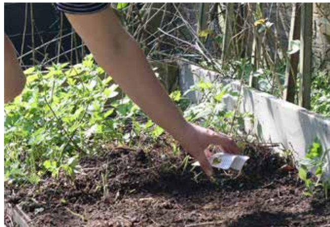
Onze geplande investeringen in het openbare groen hebben als uiteindelijke doelstelling de gewone burger bewuster en actiever in de eigen directe natuurlijke omgeving te maken.

Onder de giften valt ook de sponsoring door bedrijven. In Buitenpost zijn een aantal grotere bedrijven gevestigd die in het verleden hun maatschappelijke betrokkenheid hebben getoond. Het is aannemelijk dat zij ook bij dit groene project substantieel willen steunen.