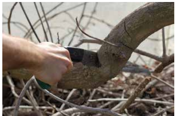
Snoeien doet groeien en bloeien. Ons project is een van lange adem, bijna zonder tijdslijm waar blijvende aandacht voor nodig is.

Communicatie is ook hier. Duidelijkheid over contactpersonen en adequaat reageren op berichten en vragen is nodig. Het is onderdeel van het werk van het Steunpunt en Zorggroep.