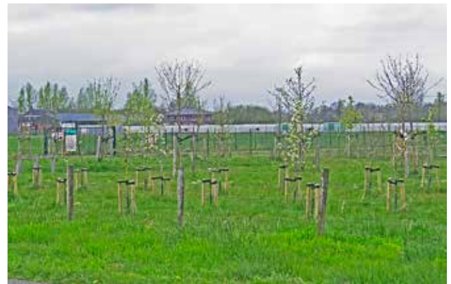
De Sinnegreide van Solarfields op industrieterrein De Swadde is een uitstekend aanknopingspunt voor de Eetbaar-groen route.

Volgens afspraak heeft uitbater Solarfields in 2017 een ruimte bij de ingang van haar zonnepark Sinnegreide in het Oost voor groen gereserveerd. De eerste aanplant is deels mislukt. Dit stuk grond is uitermate geschikt voor een hofje onder de naam Zonnehof. Gezien hun in contract vastgelegde maatschappelijke doelstellingen nemen wij aan dat het bedrijf open zal staan voor financiële ondersteuning en onderdeel willen worden van de Eetbaar-groen-route.