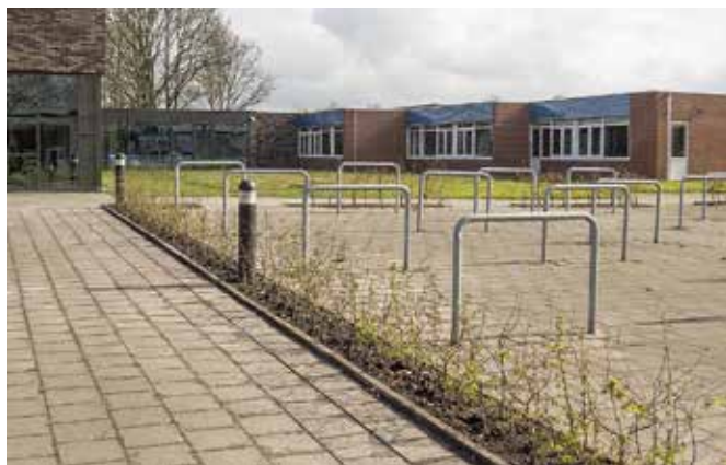
Iedere school heeft nog wel een plekje waar een fruitboom veel kan toevoegen aan de sfeer op een schoolplein. Op de foto het Lauwerscollege aan de Hoefslag.

Na afloop van het project op 31 december 2022 maakt de Stichting Eetbaar-groen Buitenpost een eindverslag over de resultaten van project. Ze geeft een overzicht van de gerealiseerde perken en haar organisatie. Een financieel hoofdstuk geeft een overzicht van de feitelijk gemaakte kosten en gerealiseerde inkomsten. Mocht het project een batig saldo opleveren dan wordt in overleg met financieel bijdragende partijen besloten wat daarmee gebeurt. Zo nodig worden naar rato van financiële bijdrage bedragen gerestitueerd.