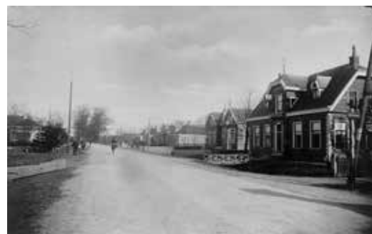
Aan het begin van de 20e eeuw was Buitenpost bijna een groot park. De komst van telefoon- en telegraafpalen en motorverkeer zorgden voor een kaalslag. De beide foto's zijn op dezelfde plek gemaakt.