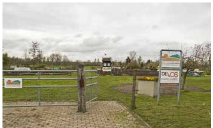
De tuin van de amateur-tuindersvereniging 'de Swadde-ikker'

Onze plaatselijke amateur-tuindersvereniging heeft op industrieterrein 'de Swadde' een eigen 2 ha grote tuin. Het is een actieve vereniging. Haar leden kweken en telen op basis biologische-dynamische principes en maken dus geen gebruik van bestrijdingsmiddelen. De vereniging is een ervaringsdeskundige bij uitstek als het gaat om lokale