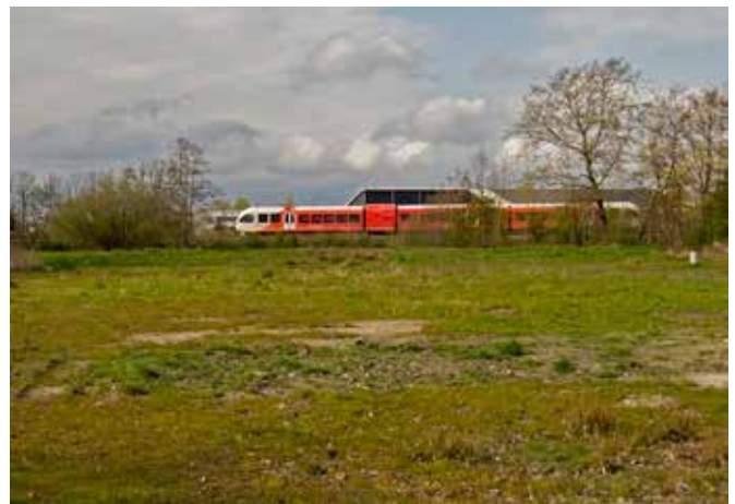
Bouwlocaties zijn ook goede gelegenheden voor Eetbaar-groen. Dit terrein op de Voorstraat krijgt op korte termijn bestemming. De buitenrand tegen de spoorbaan schreeuwt om groene invulling.