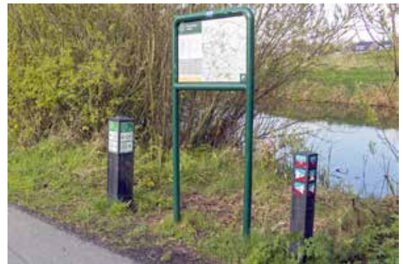
Routewijzers aan de Buitenpostervaart. Een Eetbaar-groen-route bordje zou hier prima bij passen.

Wandelen en fietsen van de route is voor veel mensen in onze aantrekkelijke plattelandsomgeving populair. Het is ook van groot belang voor de gezondheid en als ontspanning. Een Eetbaar-groen route is een ideale manier om het een met het ander te combineren. Beweging en ontspanning gecombineerd met natuurbeleving en vruchtgenot. Door het aanbieden van de route met een start- en eindpunt (bijvoorbeeld in De Kruidhof) kunnen ook mensen van buiten het dorp worden uitgenodigd in het dorp van groen te genieten. Met name de groenzoom aan de westrand van ons dorp vormt dan een fraai onderdeel van de route. Het is voorstelbaar dat in de toekomst ook zijwegen bewandeld kunnen worden. Zo kan het gecombineerd met een voet- of fietspad naar de Mieden of het gebruik van Historische Wandelpaden (ook een initiatief waar PBB zich voor inzet). Het bevorderen van telen van groenten en fruit in de eigen- of volkstuin bevordert dezelfde doelstellingen. Ons project biedt veel aanknopingspunten om deze activiteiten in het dorp te populairder te maken.