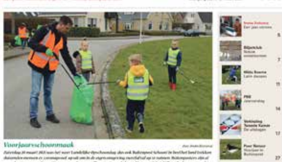
Dorpsblad De Binnenste Buiten verschijnt al 22 jaar gratis en maandelijks op alle adressen in ons dorp.