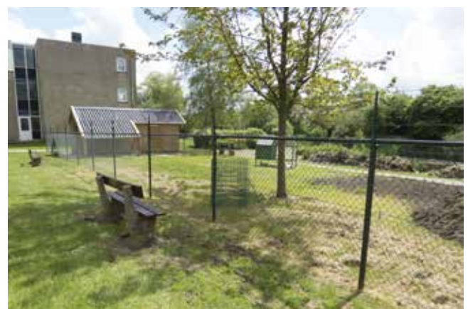
De dierenweide achter zorgcentrum Haersmahiem is èn een prima plek voor een perk en een goede bestemming voor een deel van de oogst.

De dierenweide is een in 2020 op initiatief van Plaatselijk Belang gerealiseerd project achter zorginstelling Haersmahiem. De ruimte leent zich voor toevoeging van een paar fruitbomen. De oogst kan deels voor de voeding van de dieren worden gebruikt.