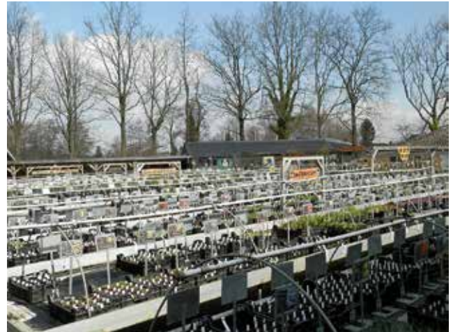
De verkooptuin van de Kruidhof, een natuurlijke start voor de invulling van onze perken.

* € 250,- voor zaad van bijen en vlinderbloemen. Een ingezaaide strook langs de rand van perken trekt extra insecten aan en is noodzakelijk voor de bestuiving van de fruitbomen.