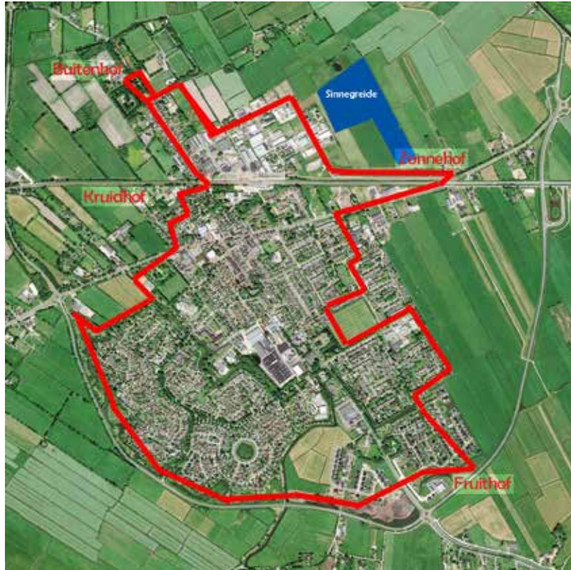
De route in vogelvlucht. Ze wordt beschreven in bijlage 4.

Ter ondersteuning van het project en vanuit recreatief-toeristisch oogpunt willen wij een Eetbaar-groen-wandel- en fietsroute in het dorp inrichten. Het zou kunnen onder de naam van Kruidhof naar Fruithof, Zonnehof en Buitenhof.