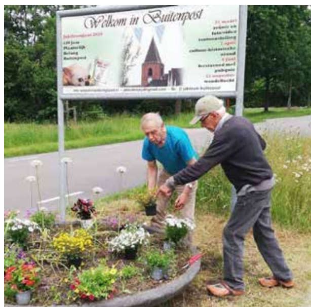
Lokale hoveniers en inwoners dragen zorg voor de bloembakken bij de toegangswegen - een bijdrage in natura.

Naast de bijdragen in geld hebben de die in natura een even grote waarde. Uitvoering van het project vraagt een minimum aan 500 vrijwilligersuren aan organisatie en uitvoering. Daarnaast doen wij een beroep op professionals om mee te doen in het project. Mensen van de MOA, de hoveniers, middenstanders en particulieren kunnen ieder op hun eigen wijze belangrijk bijdragen in het succes. Zo zijn signalering en tipgeving zijn onontbeerlijk gezien de vrij grote schaal waarop het plan plaatsvindt.