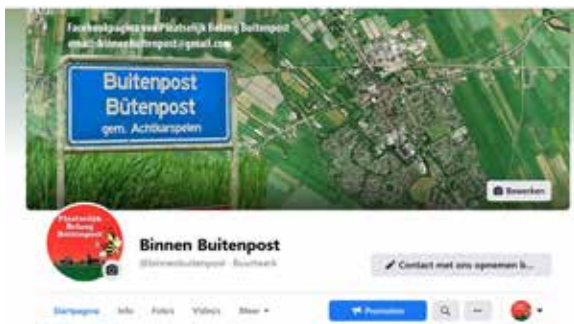
Facebookpagina Binnen Buitenpost is bijna 7 jaar in de lucht en geeft een aantal keren per week actuele, korte berichtjes over kleine en grote zaken van dorpsbelang. Ze heeft bijna 2500 volgers.