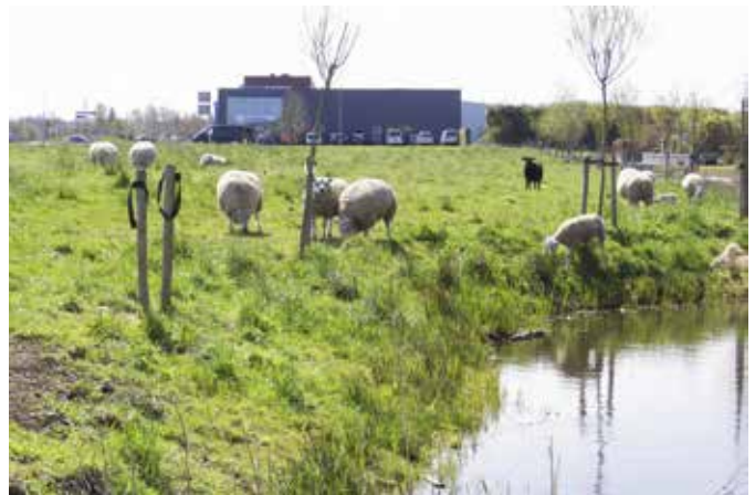
Het terrein aan de zuidrand van Buitenpost. Inrichting tot Fruithof maakt het een belangrijk onderdeel van de Eetbaar-groen-route. De gemeente Achtkarspelen is eigenaar van de grond.

Botanische museumtuin is een uitgesproken kenniscentrum op het gebied van fruit en groente. In onze samenwerking kan het een essentieel onderdeel worden. Niet alleen als start- en rustpunt worden in de route, het heeft ook een groot netwerk tot haar beschikking. En ze organiseert jaarlijks evenementen die aansluiten op ons project zoals de Kruidenmarkt en Oogstdag.